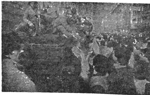
O scenă de cotitură: înfrățirea.

Văzind cadavrele de la Timișoara pe micul ecran, nu putea fi pusă la îndoială cifra de „60.000 de morți”, unii vorbeau chiar de 70.000, ca rezultat în câteva zile al insurecției române (astăzi se cunoaște că numărul morților — inclusiv partizanii lui