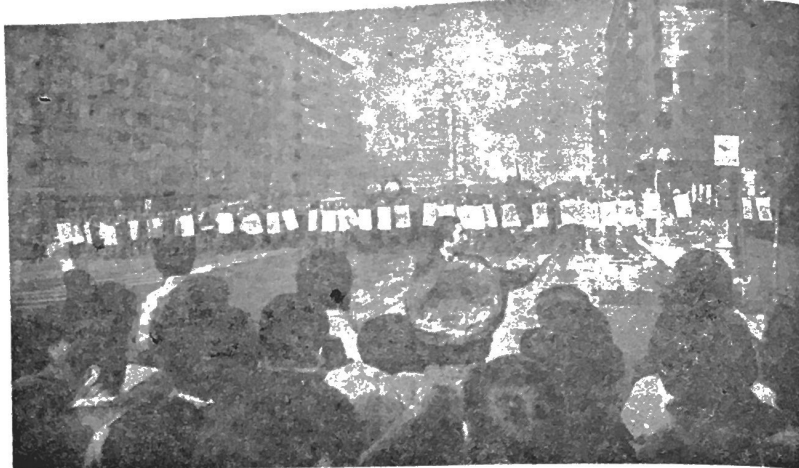
21 decembrie după amiază: față în față.

— Ceaușescu — nu depășește 700; iar la Timișoara el este sub 100 (Le Monde, 14 februarie 1990). Imaginile acestui masacru dădeau credit afirmațiilor celor mai delirante.