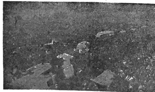
Piața Palatului în dimineața lui 22.